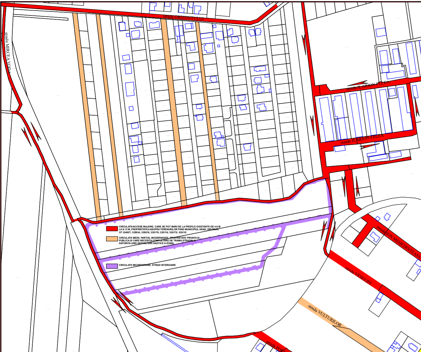
SCHEMA CIRCULATII-ACCES MAJORE/MEDII/MICI