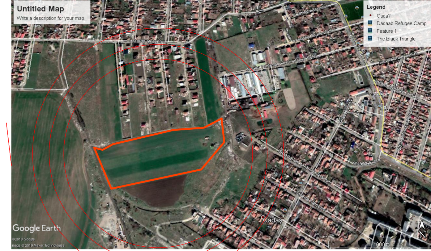
INCADRARE IN ZONA - fara scara