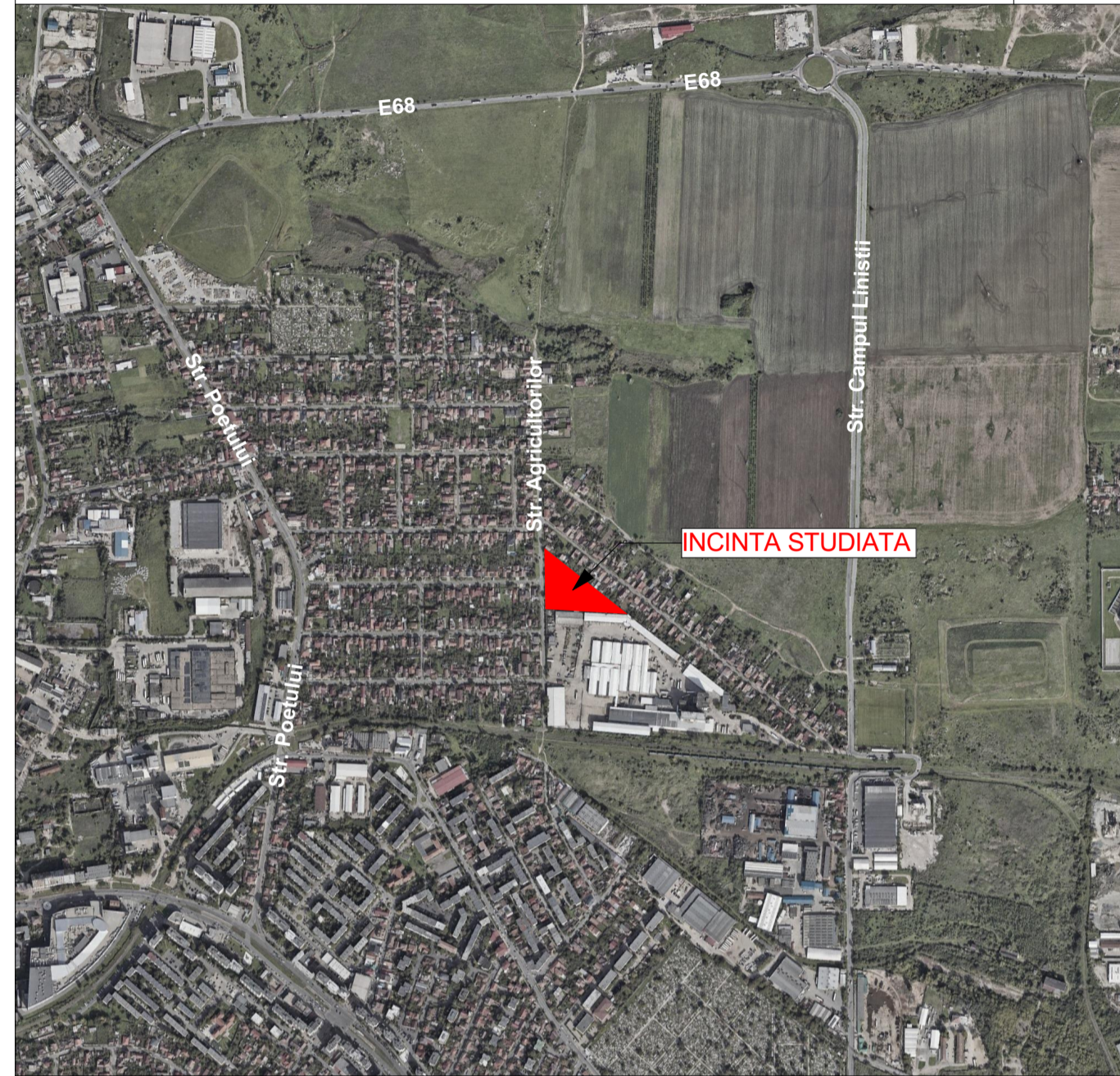
PLAN DE ÎNCADRARE ÎN ZONĂ

ÎNTOCMIRE P.U.Z. ȘI R.L.U.: „CONSTRUIRE ZONĂ REZIDENȚIALĂ ȘI FUNCȚIUNI COMPLEMENTARE”